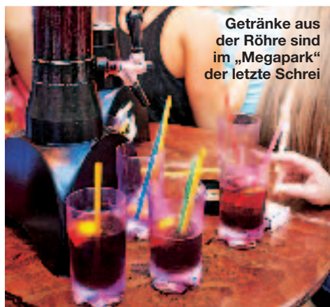
Getränke aus der Röhre sind im „Megapark“ der letzte Schrei